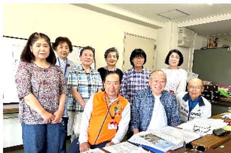
今年度のメンバー