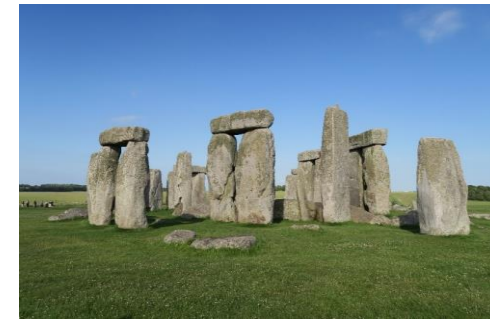
ストーンヘンジ (1986年世界遺産登録)

ストーンヘンジは神殿として築造されたもので、約5000年前、新石器時代と呼ばれる先史時代に築造された。今日の石柱の位置は最終的な位置とされ、紀元前2200年頃完成したものを20世紀に復元したものだそうです。何のために造ったのかその真相は謎に包まれたままで、太陽崇拝の儀式に使われた神殿だとか、天体観測のために造られたものだという説が有力視されています。