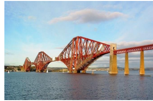
フォース鉄道橋 (2015年世界遺産登録)

フォース鉄道橋 はエジンバラの北に広がるフォース湾をまたぐ鉄道橋、全長は2528.7m、高さは104m、桁下高46m、1890年の開通当時は世界最長を誇った。カンチレバートラス(片持ち橋梁)式の鉄道橋では世界で2番目の規模だ。130年経った今日でも200本の列車がこの橋を往来している。この橋から北東に約70kmのところゴルフ発祥地として有名なセントアンドリュースのゴルフ場がある。時間と資金と技倆さえあればチャレンジするのになあ！