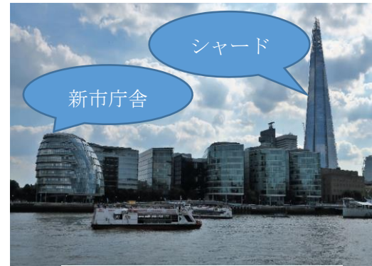
ロンドン新市庁舎とシャード

ストーンヘンジは神殿として築造されたもので、約5000年前、新石器時代と呼ばれる先史時代に築造された。今日の石柱の位置は最終的な位置とされ、紀元前2200年頃完成したものを20世紀に復元したものだそうです。何のために造ったのかその真相は謎に包まれたままで、太陽崇拝の儀式に使われた神殿だとか、天体観測のために造られたものだという説が有力視されています。