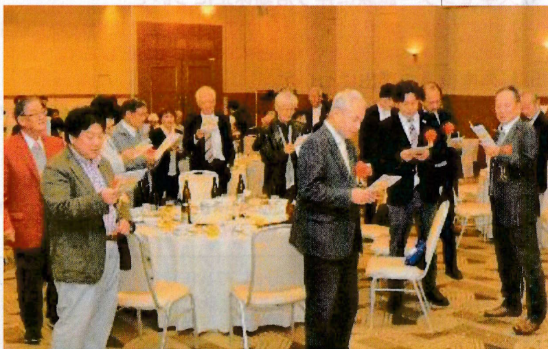
CCTソングを合唱 立ち上げ、支えて下さる来賓の方々